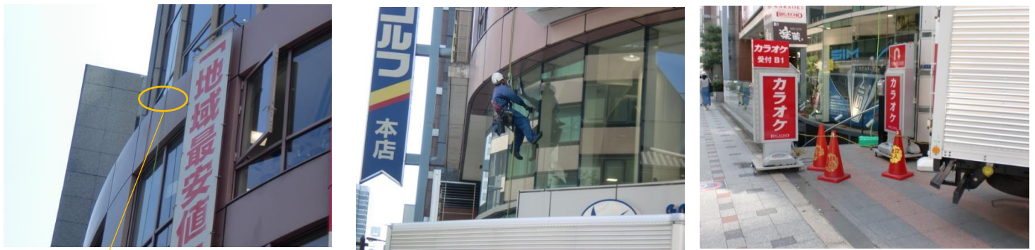
建物に接触、ロープの切断の恐れがあるため ロープ養生をして下さい