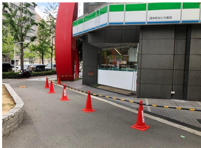
立ち入り禁止区域・地上誘導員・監視員も配置されていた。