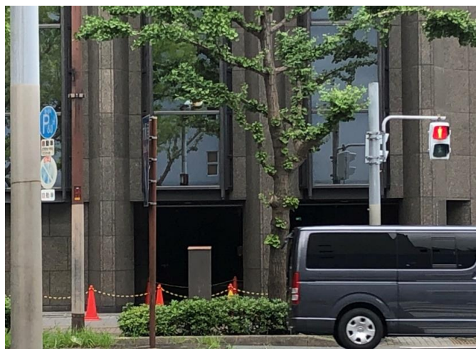
立ち入り禁止区域・地上誘導員が配置されていた。