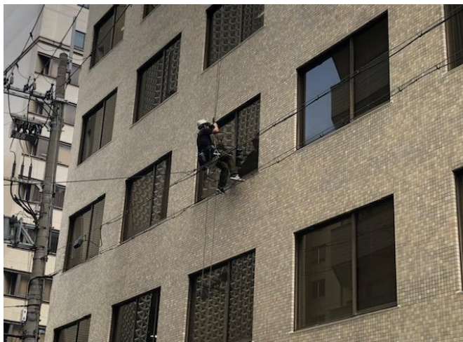
立ち入り禁止区域が確保されていた。