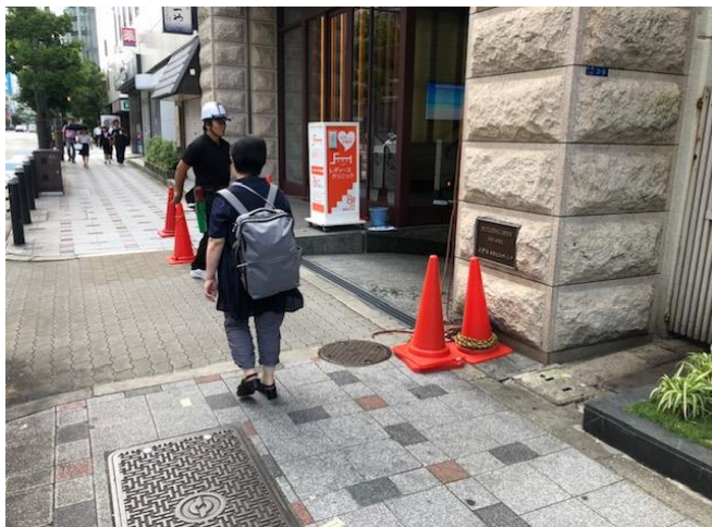
地上誘導員が配置されていた。